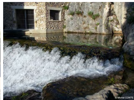
Le goul de la « Tannerie »