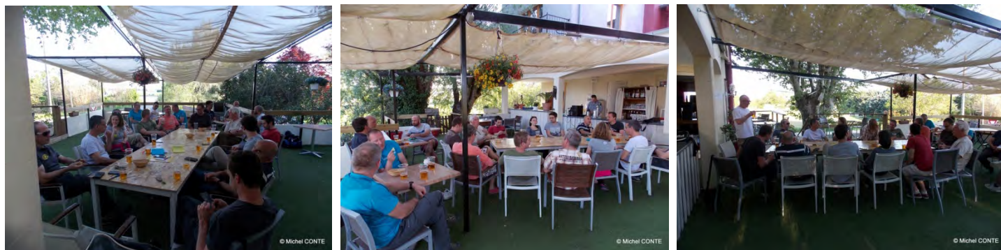
Débriefing du samedi soir devant une bière bien méritée