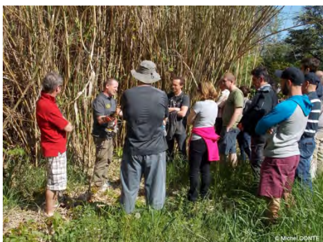
Atelier « Fil » par Denis CLUA