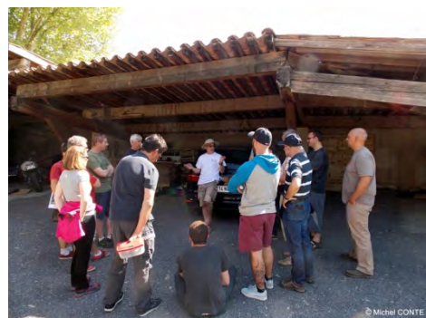
Atelier « Gestion Air » par Frédéric LEBLANC