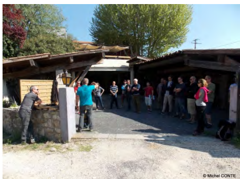
Atelier « Matériel » par Alain FOURNET

J'étais très impatient de participer à ce stage d'initiation à la plongée souterraine. Et je ne fus pas déçu par ce second volet. La qualité de l'enseignement est toujours aussi bonne, l'ambiance excellente. Grâce à la disponibilité des personnes/encadrants présents sur place, j'ai pu décrocher mon premier niveau de plongée souterraine et acquérir des connaissances nouvelles. L'organisation administrative et technique du stage a été parfaite, sans stress. Je remercie donc toutes les personnes présentes pour leur disponibilité à faire partager leur passion. Mon prochain objectif de formation : le plongeur souterrain niveau 2 !!!!