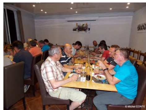
Repas convivial le samedi soir au Robinson