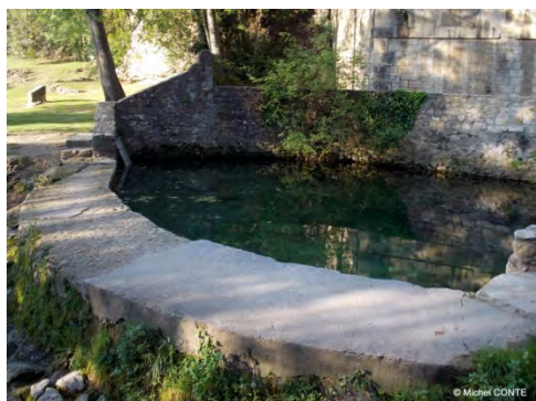
Le goul du « Pont »

Coté encadrement, merci à nos amis de la CRPS Occitanie PM qui sont venus compléter l'équipe AURA.