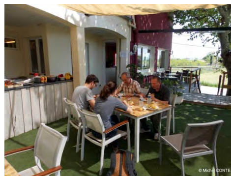
Pique nique du samedi midi sur la terrasse du Robinson